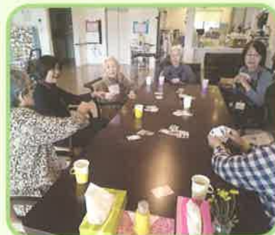
傾聴ボランティア さんとトランプ大会 で盛り上がりました。

ASOKAやないでは、多くのボランティアの方に支えられています。 これからも地域に開かれた施設運営と繋がりを大切に努めてまいります。