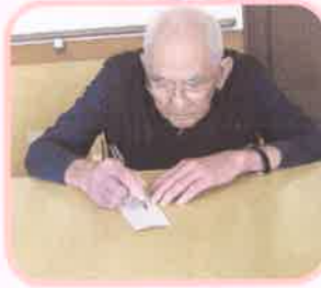
短冊に願いを 込めて・・・