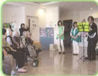
コープ山口シュワッチの皆様 手話コーラスに演奏会に盛り上がりました。