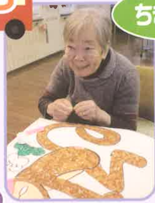
仕上がりを楽しみ!!