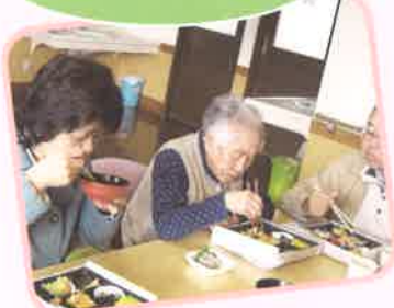
利用者ご家族様も参加され、 ひと時を楽しみました