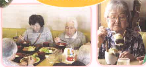
入居者様、職員全員で美味しい食事に笑顔!