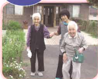
綺麗な花が咲くと 嬉しいですね (^^)