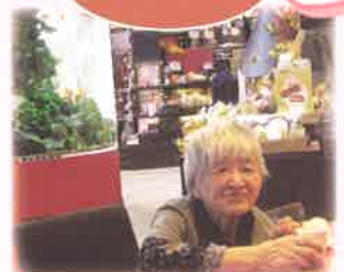
お菓子のお店で ティータイム♡