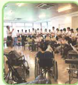
柳井中学校（広瀬地区の）生徒さんが 慰問に来て下さいました。 若いエネルギーをわけて頂きました。